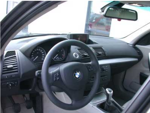
Während die Verarbeitungsqualität einen sehr guten Eindruck macht ist die Bedienbarkeit zwar weitgehend funktionell, jedoch nicht frei von Kritik.