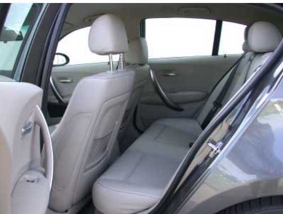
Die Kniefreiheit hinten ist eine der Schwachstellen des 1er und nicht einmal Kindern zuzumuten.