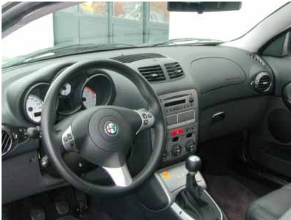
Der Innenraum verstrahlt zwar sportliches Flair, die Bedienung kann jedoch nicht in allen Punkten überzeugen.