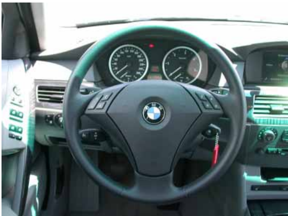
Auch die "abgespeckte" Version des i-Drive-Bedienungssystems verlangt nach einer Eingewöhnungszeit.