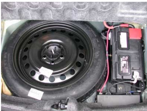
Nur ein schmales Notrad steht bei einer Reifenpanne zur Verfügung.