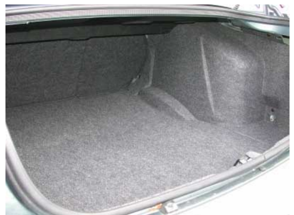
Der Kofferraum ist mit 480 l Volumen relativ groß, das Gepäck muß jedoch über eine hohe Ladekante gehoben werden.