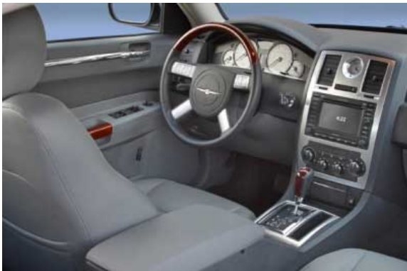
Die Verarbeitung des Innenraums kann sich nicht mit europäischen Maßstäben messen, jedoch ist durchaus eine Verbesserung zu früheren Chrysler-Modellen festzustellen.

+ Die Ergonomie der Bedienelemente ist gut, Schalter und Kontrollen sind meist griffgerecht und funktionell, man kommt bereits nach kurzer Eingewöhnung gut zurecht. Vieles funktioniert elektrisch unterstützt, wie z.B. die Lenkrad-, Sitz (mit Memory), und Außenspiegeleinstellung. Das Fahrlicht und die Wischer schalten sich per Sensor von selbst ein. Das Radio kann man auch vom Lenkrad aus bedienen. Der Bordcomputer informiert u.a. über den Momentanverbrauch, auch eine Temperatur- und Himmelsrichtungsanzeige ist vorhanden. Das Navigationssystem lässt sich logisch aber etwas umständlich einstellen. - Die Funktionssymbole für Klimaanlage, Umluft und Heckscheibe sind zu klein und schlecht zu sehen. Der Hupknopf ist weit weg in Lenkradmitte, die Tasten in den Speichen sind für andere Funktionen zweckentfremdet. Fahrer und Beifahrer müssen sich zum Schließen der Türen weit aus dem Auto lehnen, weil die Griffe zu weit weg sind. Es sollten mehr Ablagen vorhanden sein - auch für Wasserflaschen. Radio und Fenster funktionieren nur bei eingeschalteter Zündung. Angurten hinten ist schwierig, weil die Schlösser beim Einschleiben der Gurtzungen nachgeben und zwischen Sitzfläche und -Lehne verschwinden.