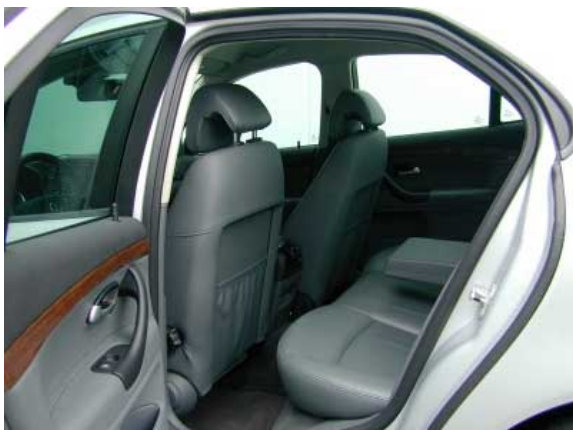
Das Platzangebot im Fond ist mäßig, besonders die Kniefreiheit ist für ein Fahrzeug der Mittelklasse zu gering.