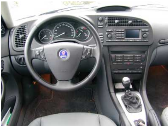
Das Armaturenbrett bietet noch immer das von Saab gewohnte Erscheinungsbild.