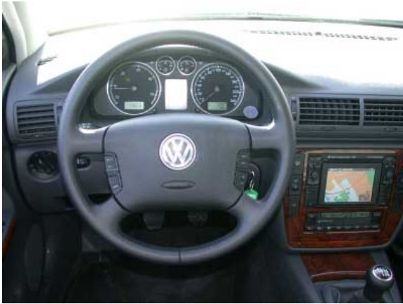
Nüchterne Funktionalität bestimmt den Innenraum des Passat.