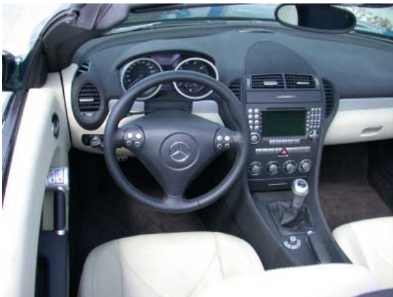
Funktionelle Bedienung und sportliches Flair verbinden sich im neuen SLK.

licht hat keine Kontrolle, dadurch hat man bei aktivierter Fahrlicht-automatik keine Rückmeldung über den momentanen Status. In der Mittelkonsole sind die Funktionssymbole schlecht zu erkennen, besonders wenn das Fahrlicht und damit die Instrumentenbeleuchtung eingeschaltet ist.