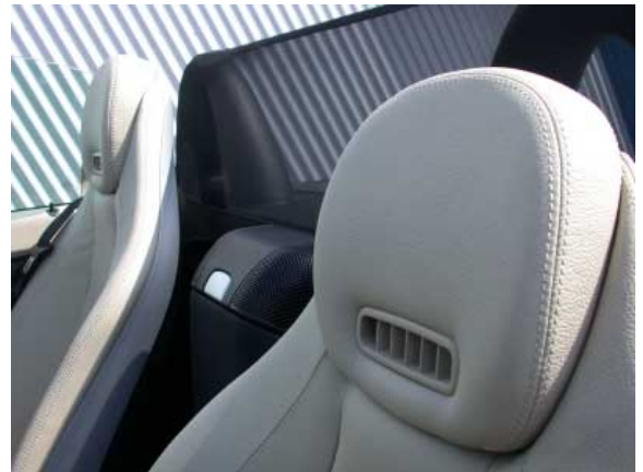
Das aufpreispflichtige Aircscarf-System mit den in den Kopfstützen integrierten Austrittsöffnungen für Warmluft macht den Cabriogenuss auch bei kälterem Wetter angenehm.

verwirbelungen bei offenem Dach angenehm gering. Um auch bei frischeren Temperaturen offen fahren zu können, gibt es auf Wunsch beheizte Sitze, ein beheiztes Lenkrad und eine Warmluftheizung (Aircscarf) für den Kopfraum.