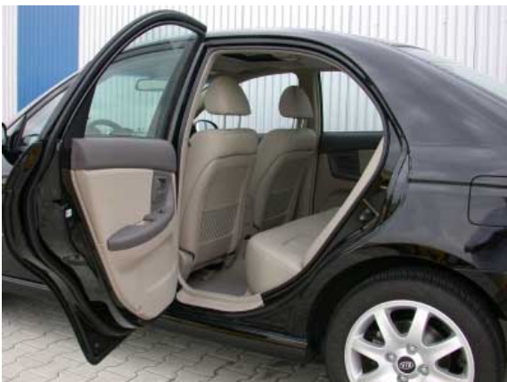
Weit öffnende Türen und eine für diese Fahrzeugklasse relativ große Kniefreiheit erleichtern den Ein- bzw. Ausstieg.