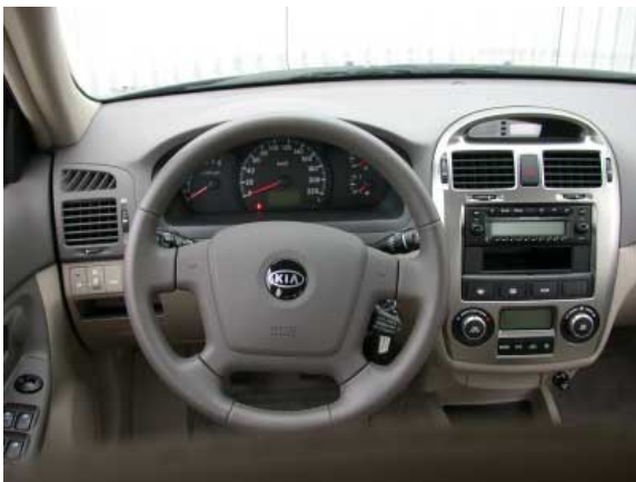
Der Fahrerplatz überzeugt durch gute Funktionalität.

– Die Kontrolle der Nebelrückleuchten ist im Schalter untergebracht und schlecht zu erkennen. An den Vordersitzen ist die Lehneinstellung grobrastig und der Hebel zur Längsverschiebung weit unten. Der Lenkradkranz ist glatt, dadurch zu wenig griffig. Zum Anlegen der Rücksitzgurte sind zwei Hände erforderlich, weil die Schösser nicht fixiert sind.