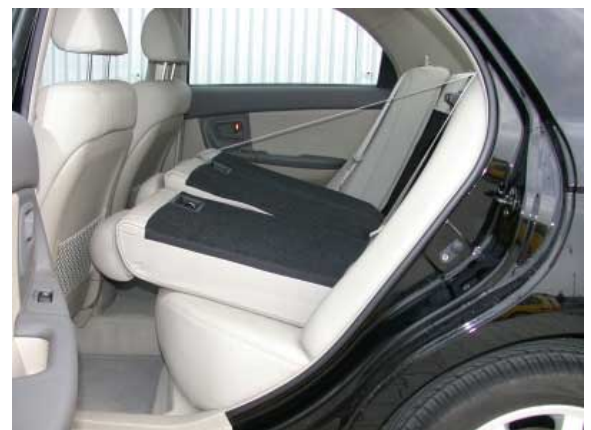
Die asymmetrisch geteilten Lehnen lassen sich nach vorne klappen, allerdings ergibt sich daraus keine ebene Ladefläche.