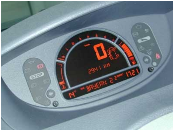
Die in der Mitte des Armaturenbretts angeordneten Instrumente sind besonders bei starker Sonneneinstrahlung sehr schlecht ablesbar.