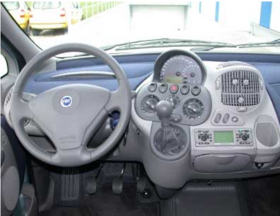
Das Armaturenbrett mit dem mittig angeordneten Instrumentenblock hat sich im Gegensatz zur äußeren Form kaum verändert.