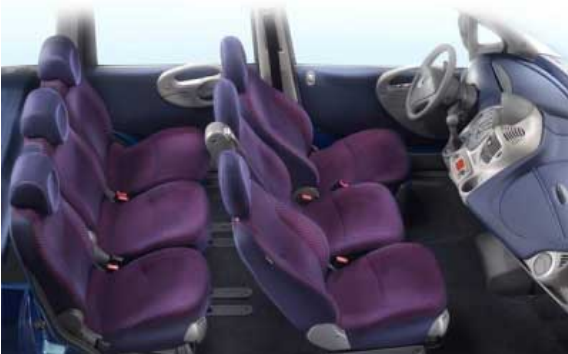
Das Raumkonzept mit zwei Dreier-Sitzreihen machte den Multipla bisher einzigartig.