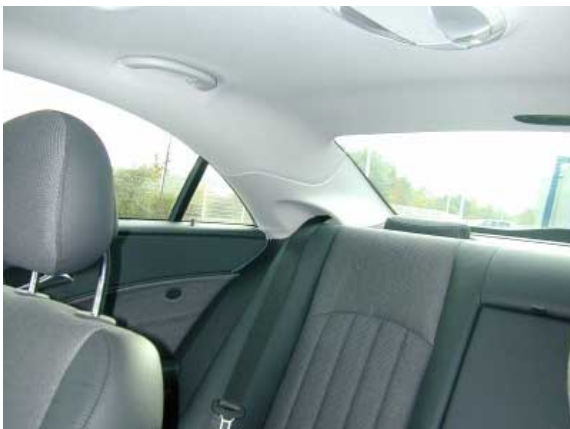
Trotz elektrisch versenkbarer Kopfstützen ist die Sicht nach hinten aufgrund der breiten C-Säule und der schmalen Fenster stark eingeschränkt.