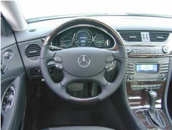
Die bogenförmigen Linien der Karosserie setzen sich bei der Gestaltung des Interieurs fort. Der von Mercedes gewohnten hervorragenden Bedienbarkeit tut dies keinen Abbruch.