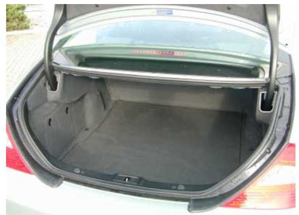
Mit 420 l Volumen ist der Kofferraum des CLS um 40 l kleiner als bei der E-Klasse. Die avantgardistische Karosserieform bedingt eine schmale Ladeöffnung.

Der Kofferraum ist mit 420 l Fassungsvermögen durchschnittlich groß. Unter dem anhebbarem Boden befindet sich ein fast 50 l großer Stauraum, sofern kein falt- oder Notrad vorhanden ist.