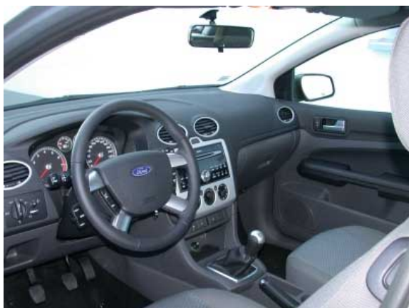
Die Abkehr vom New-Edge-Design macht sich auch im Innenraum bemerkbar. Der Funktionalität schadet es nicht.