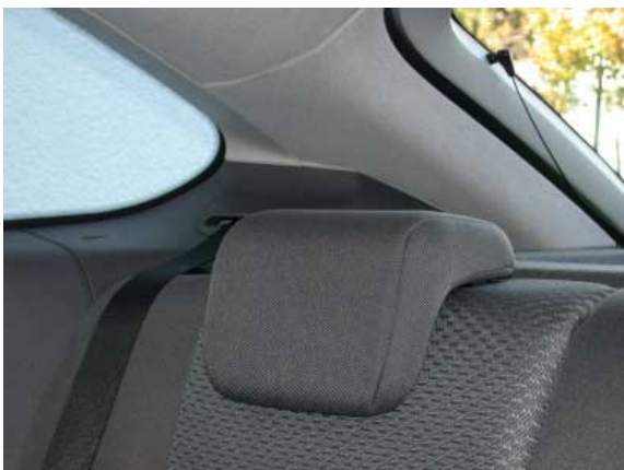
Die hinteren Kopfstützen lassen sich fast vollständig versenken und schränken damit die Sicht nach hinten nicht ein.