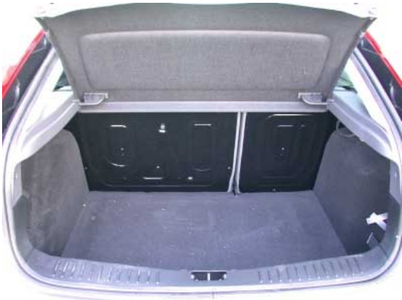
Mit 360 l Volumen übertrifft der neue Focus geringfügig die Konkurrenten wie VW Golf oder Opel Astra