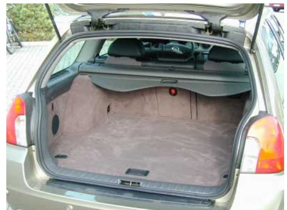
Trotz der Änderung auf Heckantrieb blieb der Kofferraum etwa gleich groß wie beim frontgetriebenen Rover 75.

erschweren das Verstauen sperriger Gegenstände.