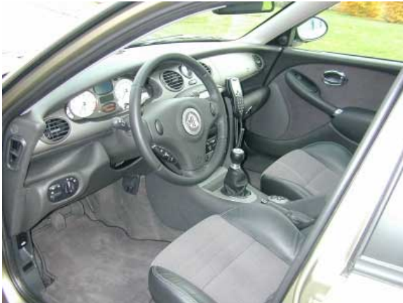
Die stilvolle Gestaltung mit Holz und Chrom des Rover 75 wurde beim MG "sportlicheren" Kunststoffoberflächen geopfert.