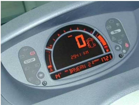
Die in der Mitte des Armaturenbretts angeordneten Instrumente sind besonders bei starker Sonneneinstrahlung sehr schlecht ablesbar.