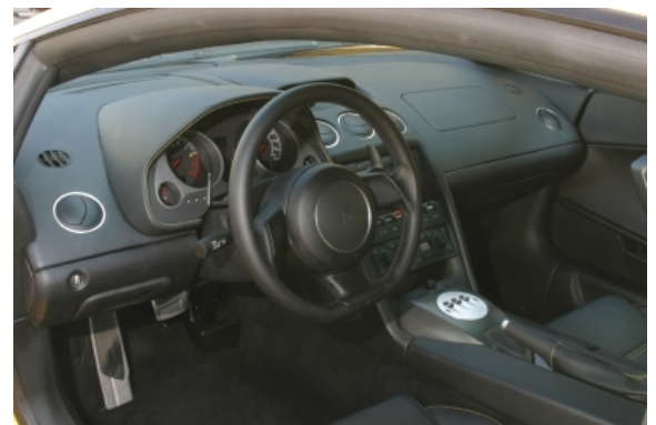
Der Innenraum des Gallardo ist weitgehend funktionell, die Verarbeitungsqualität ist gut und lässt den Einfluss von Audi durchaus erkennen.