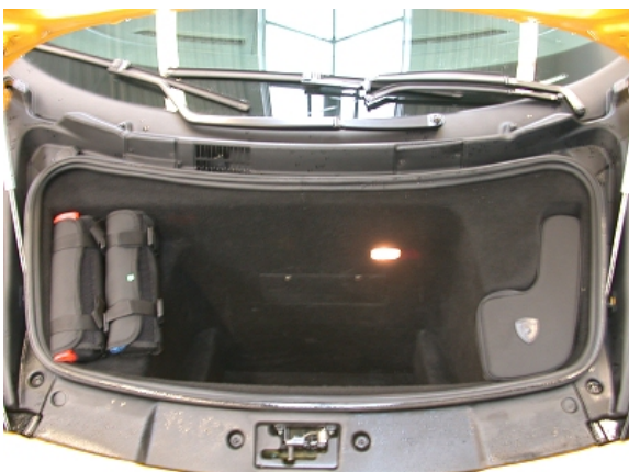
Der Kofferraum unter der Fronthaube fasst gerade mal 80l Gepäck.