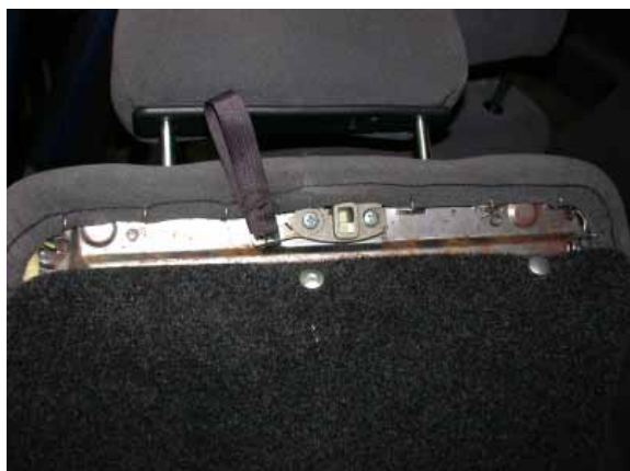
Auffällig: Unverkleidete Blechprofile an der Rückseite der Rücksitzlehnen.