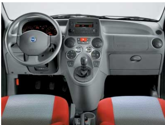
Modernes, jedoch nicht immer funktionelles Design kennzeichnet den Panda 4X4.