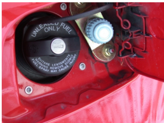
Neben dem Tankverschluss für den Benzinkraftstoff liegt der Füllstutzen für das Erdgas.