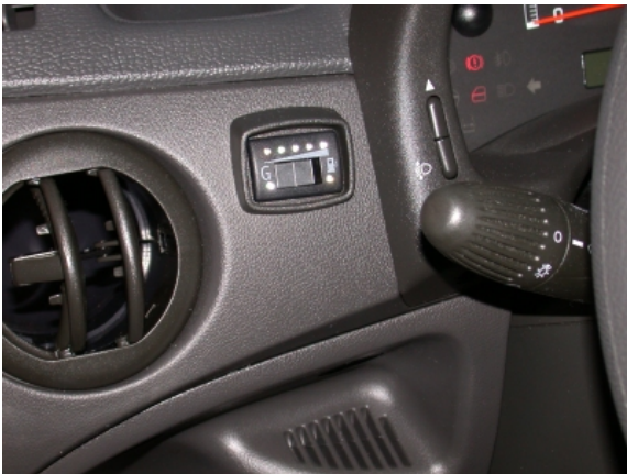
Der Füllstand des Gasbehälters kann anhand einer Anzeige mit Leuchtdioden links vom Lenkrad abgelesen werden.