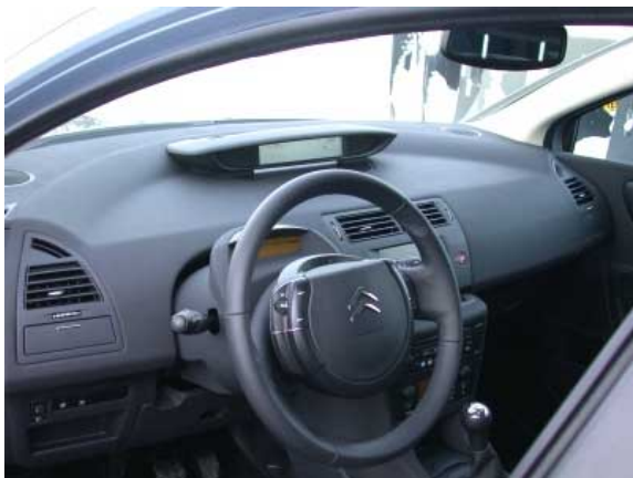
Futuristisch wie das Äußere ist auch der Innenraum des C4. Der Funktionalität nützt dies nicht immer.