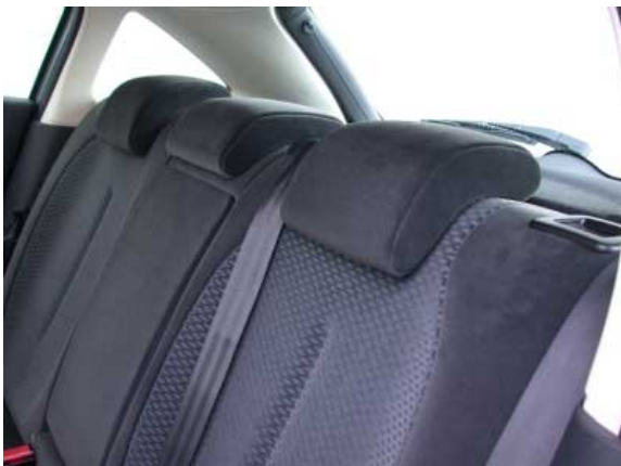
Trotz versenkbarer Kopfstützen ist die Übersichtlichkeit des C4 eingeschränkt.