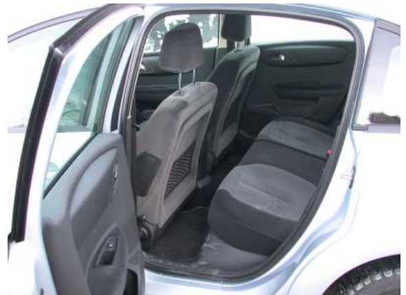
Aufgrund des geringen Knieraums ist das Ein- bzw. Aussteigen hinten eine beschwerliche Angelegenheit.