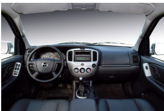
Sowohl die Verarbeitung als auch die Funktionalität im Innenraum sind nicht frei von Kritik.