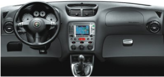
Weiß unterlegte Rundinstrumente unterstreichen den sportlichen Charakter des 147.