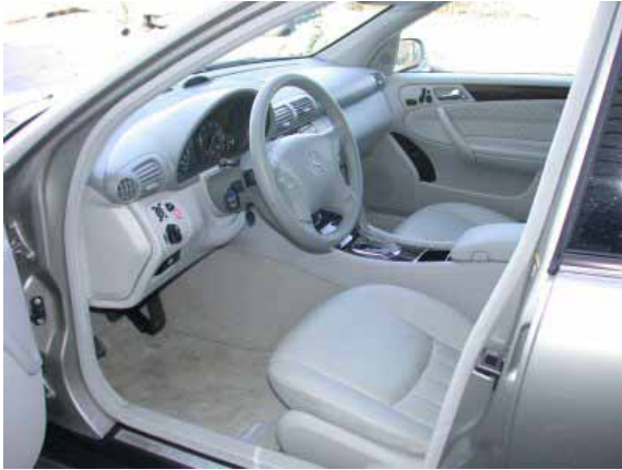
Wie von Mercedes nicht anders zu erwarten ist die Bedienung der C-Klasse einfach und funktionell. Lediglich die Bedienelemente der Klimaanlage sind zu tief positioniert.