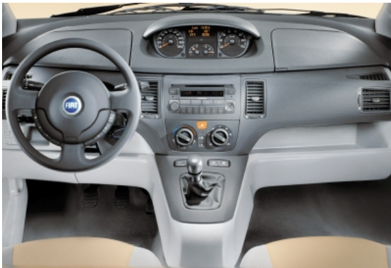
Die Instrumente befinden sich einem Trend folgend in der Mitte des Armaturenbretts und damit außerhalb des direkten Sichtfelds des Fahrers.