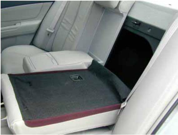
Die serienmäßig umklappbaren Rücksitzlehnen ermöglichen den Transport längerer Gegenstände.