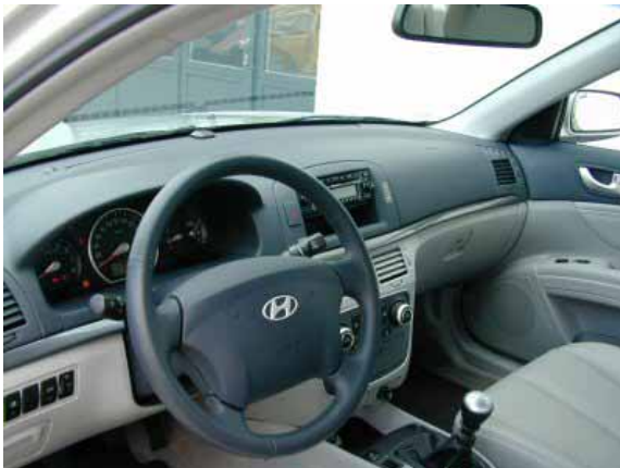
Auch wenn das Innenraumdesign noch nicht höchsten Ansprüchen genügen kann, so ist in der Auswahl der verwendeten Materialien und in der Verarbeitung eine deutliche Verbesserung zum Vorgänger zu erkennen.