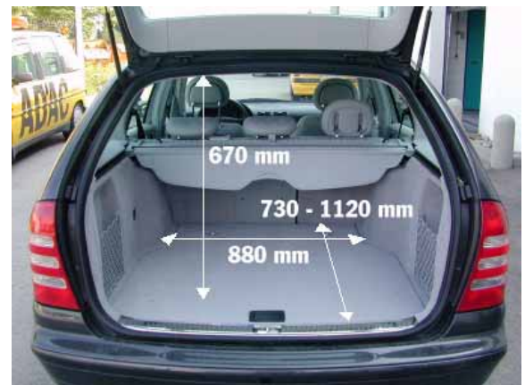
Großes Transportvolumen stand bei der Konzeption der neuen C-Klasse nicht im Vordergrund. So fasst der Kofferraum nur 345l Gepäck, die abfallende Dachlinie schränkt die Nutzbarkeit zusätzlich ein.