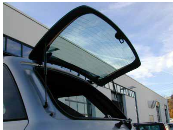
Ob hier BMW Pate gestanden hat? Auf jeden Fall erleichtert die separat zu öffnende Heckscheibe das Beladen.