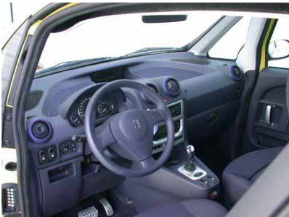
Die Bedienung ist weitgehend funktionell, die Verarbeitung sauber. Etwas mehr Farbe würde jedoch besser zum Charakter des Fahrzeugs passen.