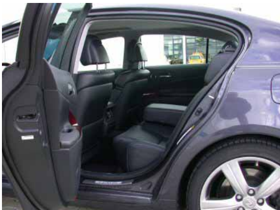
Trotz der breiten Türen ist das Ein- bzw. Aussteigen im Fond aufgrund des niedrigen Dachs beschwerlich.

Das Kofferraumvolumen ist mit 420 Liter durchschnittlich groß.