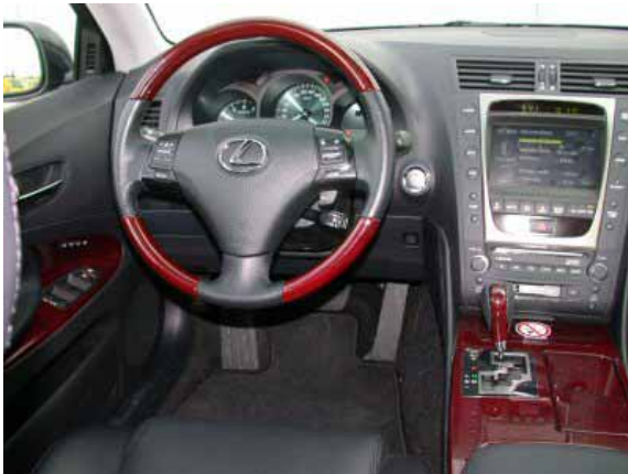
Eine herausragende Verarbeitung und eine Vielzahl von elektrischen Bedienhilfen kennzeichnen den GS, die Funktionalität könnte noch etwas verbessert werden.