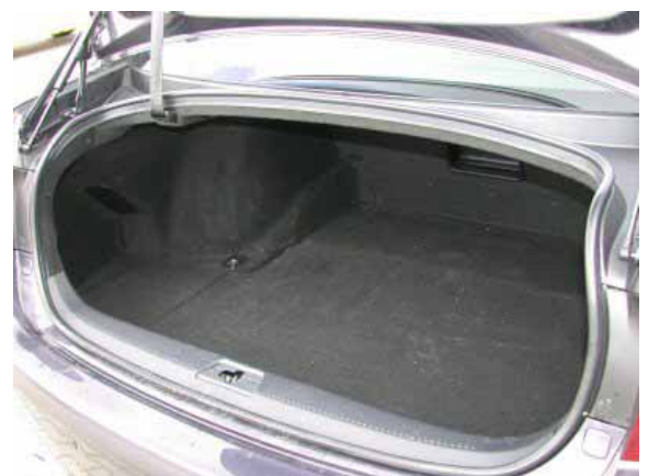
Mit 420 l Volumen ist der Kofferraum des Lexus erheblich kleiner als bei der deutschen Konkurrenz, wie z.B. beim Audi A6 mit 510 l.