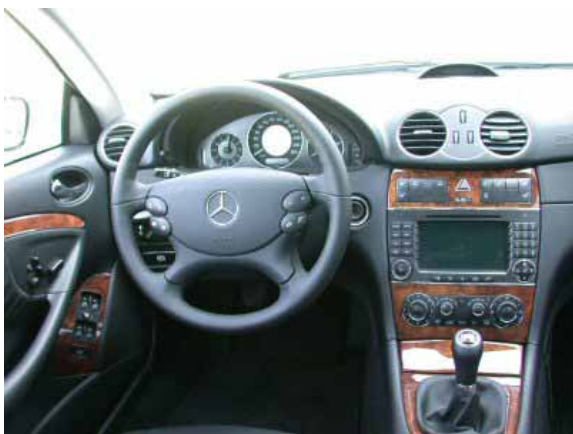
Komfort, Funktionalität und Verarbeitungsqualität sind beim CLK vorbildlich.