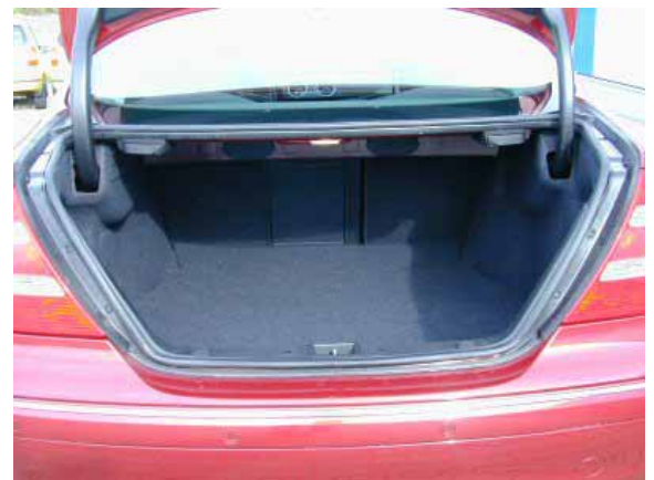
Mit 380 l Volumen ist der Kofferraum geringfügig größer als beim BMW 3-er Coupé.

Mit 380 l Fassungsvermögen ist das Kofferraumvolumen durchschnittlich.