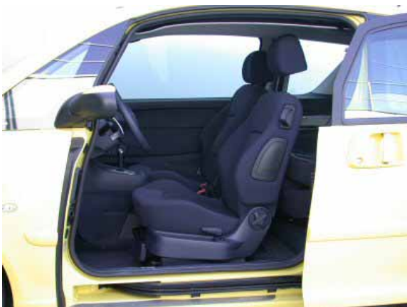
Dank der riesigen Türöffnungen und dem hohen Dach ist der Einstieg zu den vorderen Sitzen sehr komfortabel.