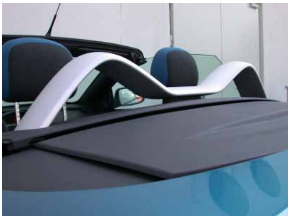
Stahlbügel sollen die Insassen bei einem Überschlag schützen.