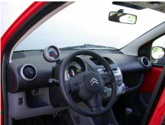
Das Design des Fahrerplatzes ist modern, die Verarbeitung relativ gut und die Bedienung bis auf wenige Ausnahmen funktionell.