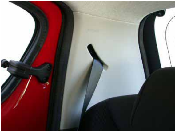
Trotz der relativ guten Übersichtlichkeit stören die sehr breiten C-Säulen die Sicht nach schräg hinten.

tet und verschmutzen, auch verkratzt das nackte Blech schnell. Die elektrischen Sicherungen sind erst nach Demontage der Taehoverkleidung zugänglich. Dazu braucht man Werkzeug, das nicht beiliegt.