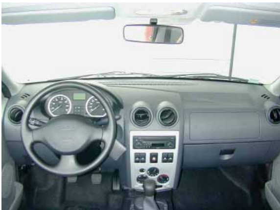
Zeitgemäßes Design und ordentliche Verarbeitung sprechen für den Logan. Die Funktionalität ließe sich jedoch ohne großen Aufwand noch verbessern.