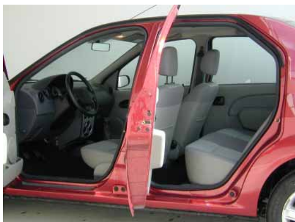
Große, weit öffnende Türen und das angenehme Sitzhöheniveau erleichtern den Ein- und Ausstieg.