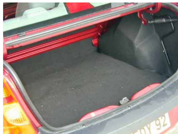
Der 445 l große Kofferraum lässt auch bei der Urlaubsreise kaum Wünsche offen.