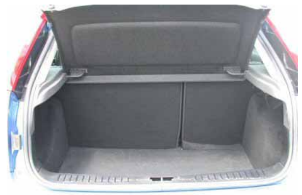
Mit 360 l Volumen übertrifft der neue Focus geringfügig die Konkurrenten wie VW Golf oder Opel Astra.