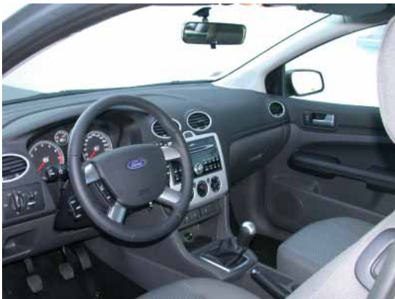
Die Abkehr vom New-Edge-Design macht sich auch im Innenraum bemerkbar. Der Funktionalität schadet es nicht.