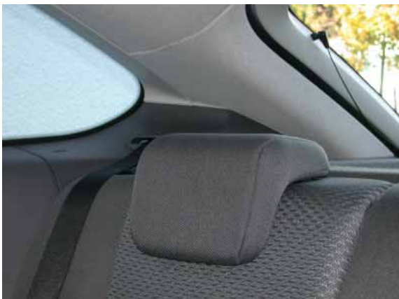
Die hinteren Kopfstützen lassen sich fast vollständig versenken und schränken damit die Sicht nach hinten nicht ein.

Mit 360 l ist der Kofferraum relativ groß (mit vollwertigem Ersatzrad fasst er allerdings gut 100 l weniger). Bei vorgeklappten Rücksitzlehnen erhöht sich die Kapazität auf 745 l (gemessen bis zur Fenster-Unterkante).