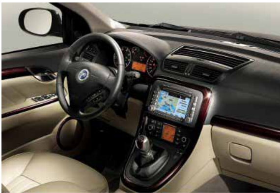
Weitgehend funktionell und ordentlich verarbeitet zeigt sich der Fahrerplatz, was man von Fiat-Fahrzeugen bisher nicht immer erwarten konnte.