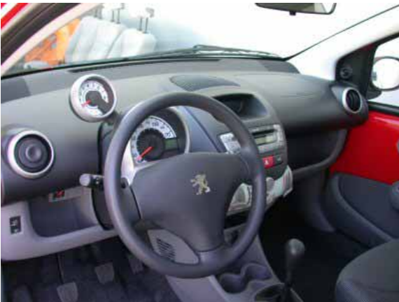
Modernes Design und saubere Verarbeitung sprechen für den 107. Störend sind dagegen die schlecht ablesbaren Instrumente.