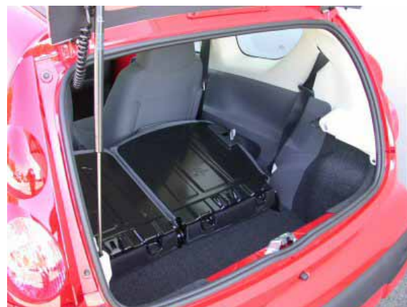
Nur 140 l fasst das Gepäckabteil des 107. Zusätzlich stört eine Stufe im Kofferraumboden, wenn die Lehnen der Rücksitze nach vorn geklappt sind.