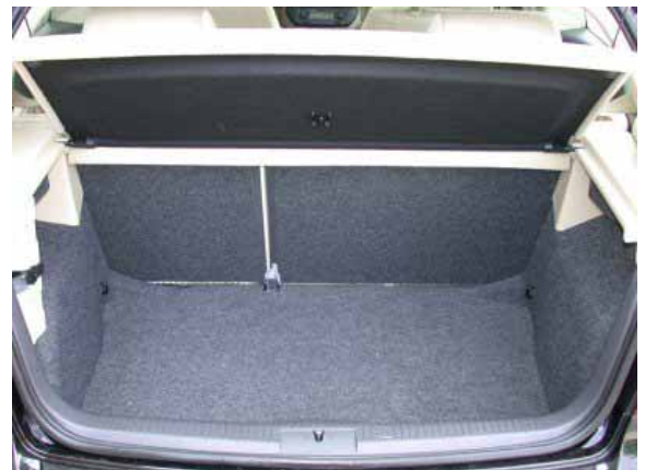
Mit 255 l Volumen ist der Kofferraum um 15 l kleiner als beim Konkurrenten Ford Fiesta.