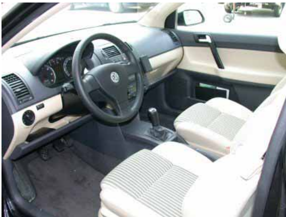
Neben der guten Funktionalität überzeugt der Polo durch seine hohe Verarbeitungsqualität.