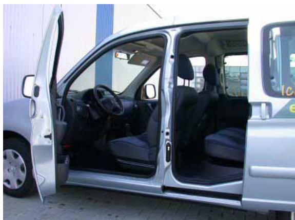
Sowohl vorne als auch hinten sind der Zu- bzw. Ausstieg sehr bequem möglich.