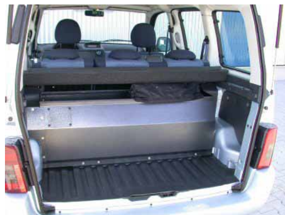
Aufgrund des im Kofferraum vor einer Trennwand verankerten Gastanks stehen lediglich 265 l Gepäckvolumen zur Verfügung.