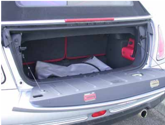
Nur 130 l Volumen bietet der Kofferraum des Mini Cabrio.