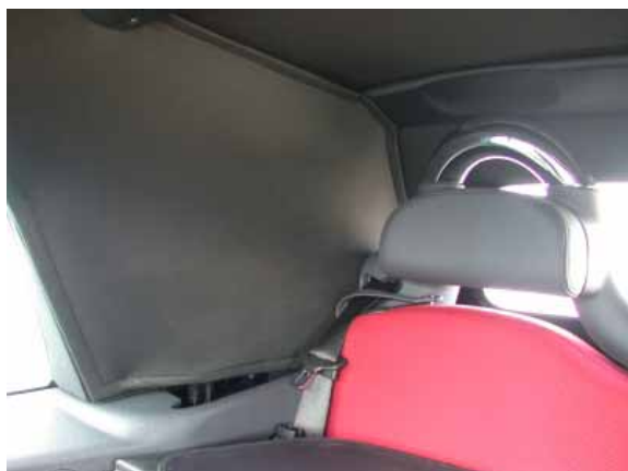
Bei geschlossenem Verdeck ist die Sicht, besonders nach schräg hinten, sehr schlecht.

Verfügung, mit dem nur kleinste Schäden notdürftig repariert werden können. Ein Notrad kostet extra.