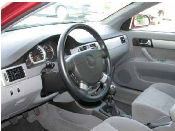
Eine ordentliche Verarbeitung und weitgehend funktionelle Bedienung kennzeichnen den Nubira. Störend ist die zu tief positionierte Bedienung der Klimaanlage.