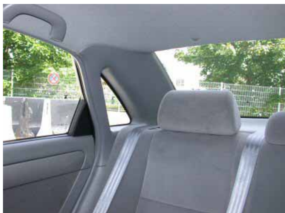
Die nicht versenkbaren Kopfstützen und die breiten C-Säulen schränken die Sicht nach hinten stark ein.