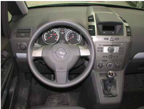
Schnörkelloses, funktionelles Design bestimmt den Zafira.