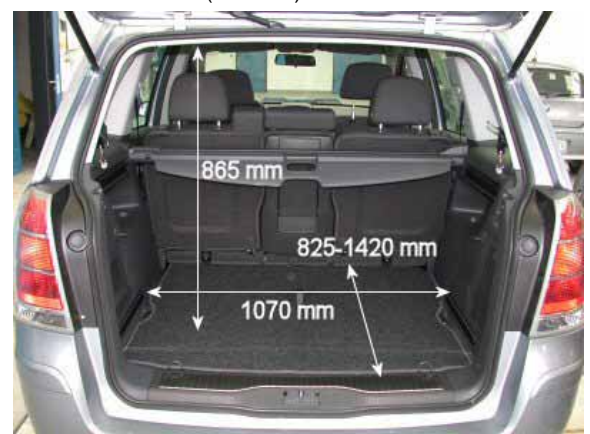
Mit 495 l Volumen ist der Kofferraum des Zafira um 20 l größer als beim Konkurrenten VW Touran.