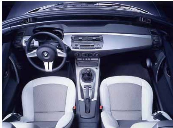
Im Innenraum des Z4 ist die neue BMW-Designlinie erkennbar, wenn auch eleganter als im 5er oder 7er.

speichen sind für andere Funktionen zweckentfremdet. Es sind zu wenig Ablagen vorhanden und das Handschuhfach ist klein.