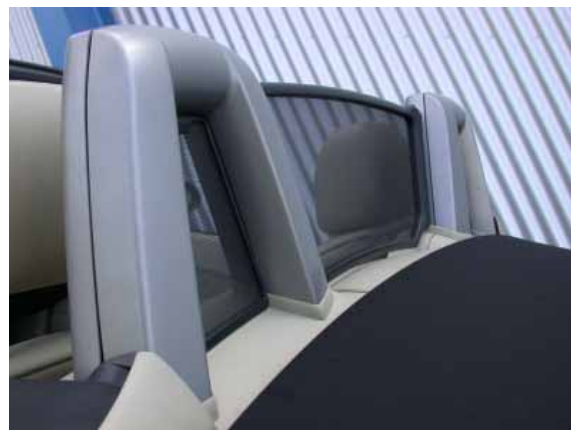
Der Z4 ist mit stabilen Überrollbügeln ausgestattet. Versuche haben gezeigt, daß solche Bügel die Insassen bei einem Überschlag wirksam schützen können.