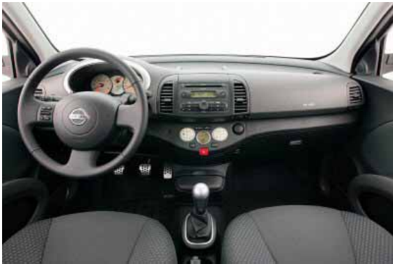
Die einfache, funktionelle Bedienung und gute Verarbeitungsqualität sprechen für den Micra.