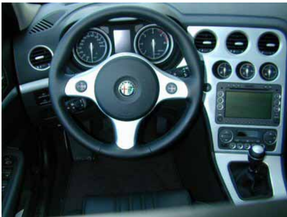
Der Innenraum des 159 macht auf den ersten Blick einen sportlichen, attraktiven Eindruck. Geht man jedoch ins Detail, offenbaren sich Schwächen bei der Handhabung und in der Verarbeitung.