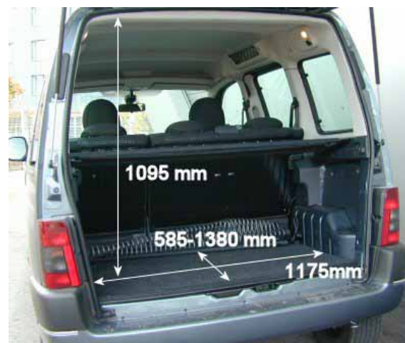
Mit 470 l Volumen ist der Kofferraum des Partner kleiner als bei den Konkurrenten Renault Kangoo (492 l) und Fiat Doblo (555 l).