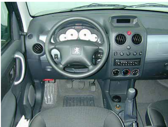
Sowohl die Verarbeitung des Innenraums als auch die Funktionalität lassen Raum für Verbesserungen.