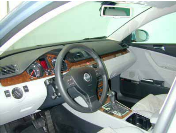
Das betont sachliche Innenraumdesign wird in der Highline-Ausstattung durch Holzapplikationen im Bereich des Armaturenbretts aufgewertet.