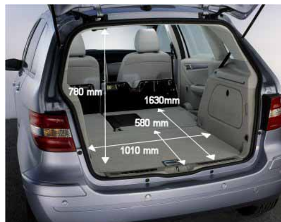
Der Kofferraum der B-Klasse fasst mit 390 l Volumen genau 100 l mehr als die A-Klasse.

unterkante). In der Tirefit-Version stehen unter dem Kofferraumboden weitere 65 l Stauraum zur Verfügung.