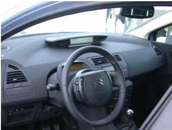
Futuristisch wie das Äußere ist auch der Innenraum des C4. Der Funktionalität nützt dies nicht immer.