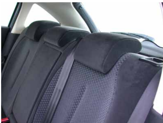
Trotz versenkbarer Kopfstützen ist die Übersichtlichkeit des C4 eingeschränkt.

Die Kofferraumgröße ist mit 315 l durchschnittlich. Bei vorgeklappter Rücksitzlehne sind es 635 l (gemessen bis Fensterunterkante).