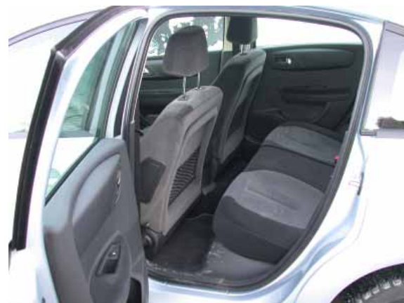
Aufgrund des geringen Knieraums ist das Ein- bzw. Aussteigen hinten eine beschwerliche Angelegenheit.