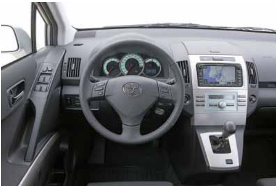
Einfache Bedienung und hochwertige Verarbeitungsqualität kennzeichnen den Fahrerplatz.