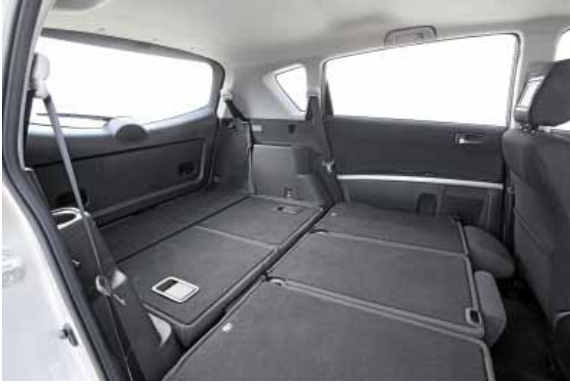
Mit wenigen Handgriffen lässt sich der Kofferraum auf bis zu 715 l Volumen erweitern.