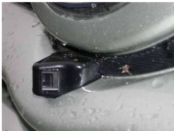
Eine im Bug eingebaute Kamera ermöglicht die Beobachtung des vorausliegenden seitlichen Verkehrsraums auf einem Monitor und damit ein gefahrloseres Einfahren in einen Kreuzungsbereich.