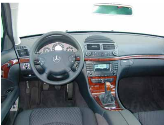
Alle wichtigen Bedienelemente liegen griffgünstig in Fahrernähe. Das Design erinnert stark an die S-Klasse.