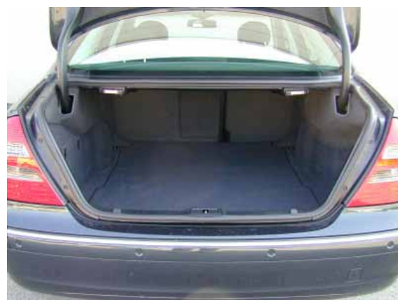
Mit 460 l Volumen ist der Kofferraum der E-Klasse deutlich kleiner als beim Konkurrenten Audi A6 (510 l).